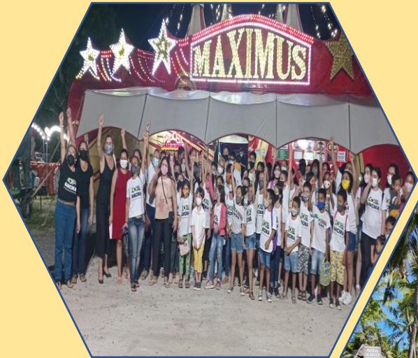
Espectáculo no Circo Maximus