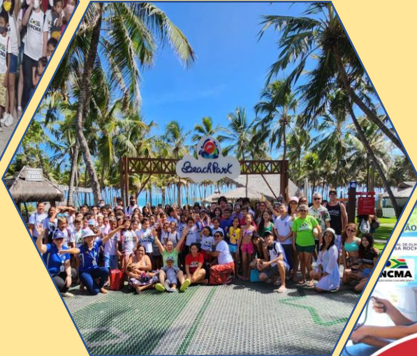
Dia de Alegria Beach Park