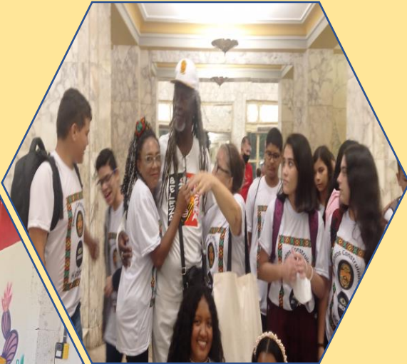
Formação de plateia com ILÊ AIYÊ no Teatro São Luiz