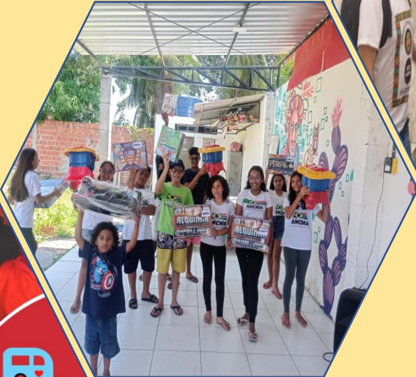
Doação brinquedos da RI HAPPY